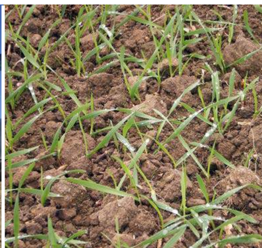
Uprawa pszenżyta GreenMasterem