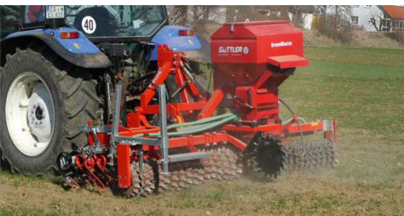
Pobudzenie krzewienia oziminy, zagnieżdżenie podsiewu w zbożu.