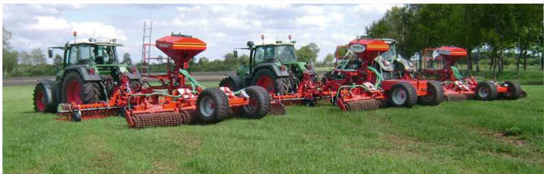
Trzy z obecnie sześciu GreenMaster znajdujących się w posiadaniu Hansa GmbH.