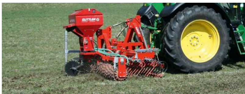
Rozprowadzenie obornika za pomocą GreenMaster 300