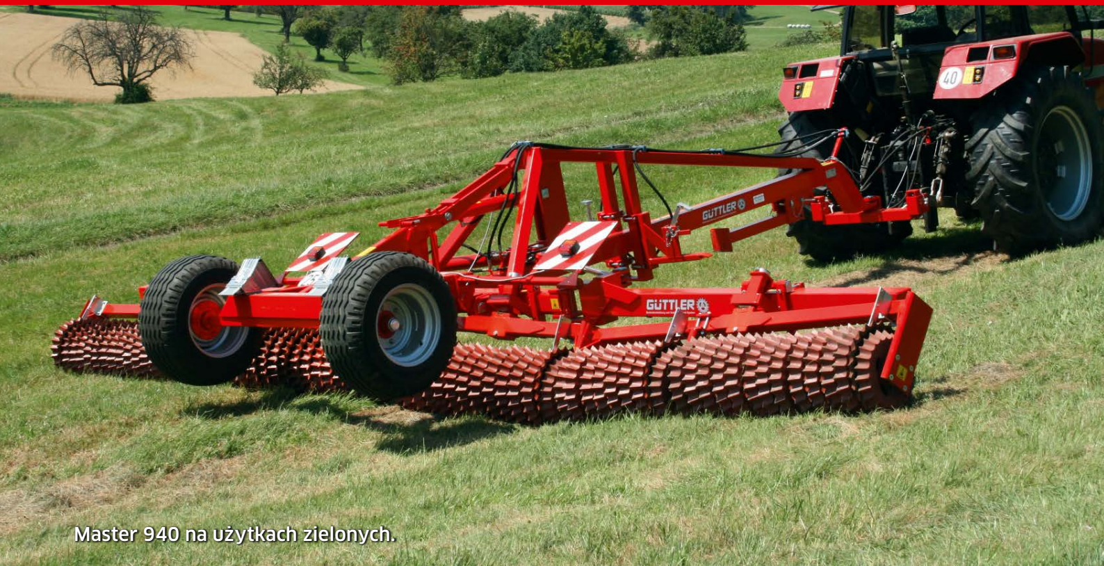
Master 940 na użytkach zielonych.