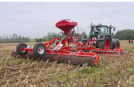
Zwalczanie omacnicy prosowianki

Obok pielęgnacji użytków zielonych na wiosnę, oferujemy również od 2009 roku zwalczanie omacnicy prosowianki z jednoczesnym zazielenianiem ozimym. Sprzęt jest w pełni wykorzystany. Każdą maszyną obrabiamy wiele setek hektarów rocznie”.