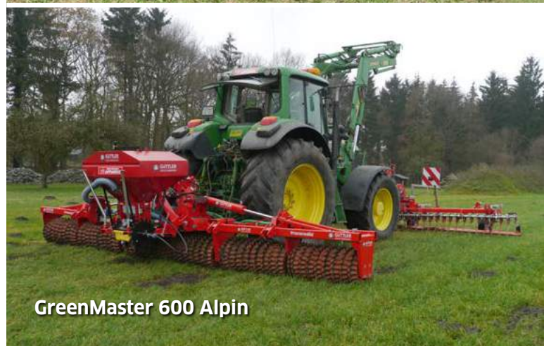
GreenMaster 600 Alpin