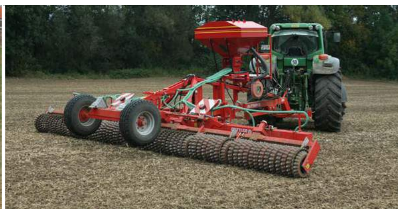
Wałowanie przed lub po siewie.