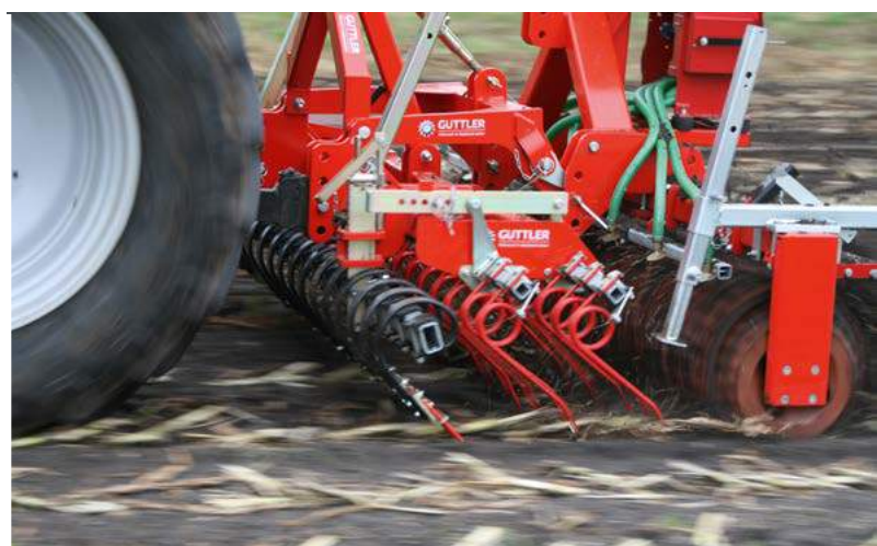
Zwalczanie omacnicy prosowianki, zagieźdzenie oziminy

Wyrównane rozmieszczenie obciążenia, niski punkt ciężkości, pewna praca.