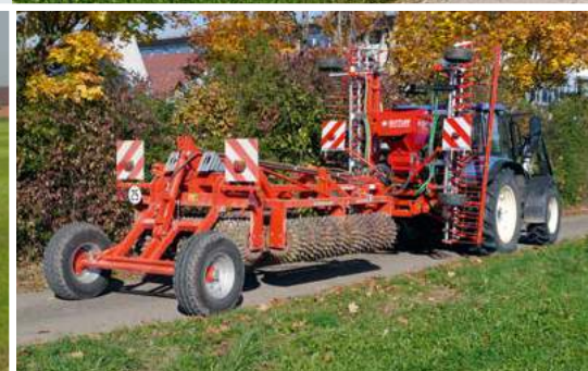
Szerokość transportowa 2,5 m