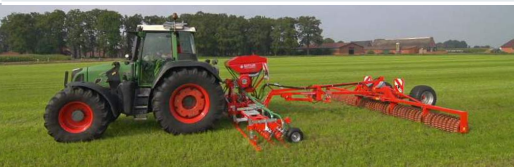
Green Seeder 600 z dołączonym Mayor 640