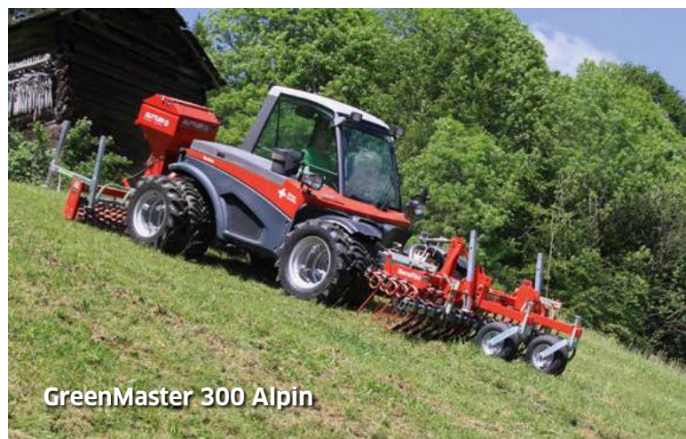
GreenMaster 300 Alpin

Gęstość wysiewu 5 kg/ha trawy pastwiskowej i masie 1000 szt. ziarna 2,5 gr daje jakby nie było 200 nasion na metr kwadratowy.