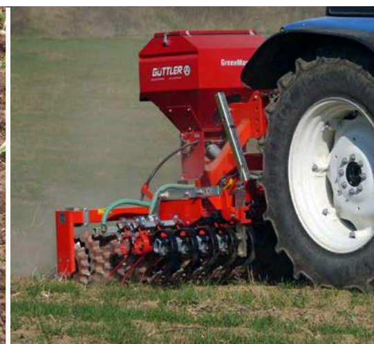
Wprowadzenie podsiewów do zbóż ozimych, pobudzenie krzewienia.