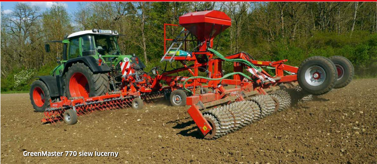
GreenMaster 770 siew lucerny